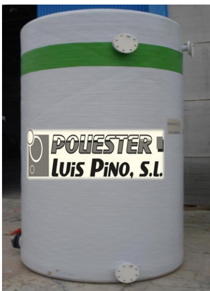
IMAGEN NO CONTRACTUAL